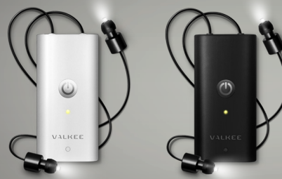
Das Valkee Tageslicht-Headset ist in schwarz und weiß erhältlich